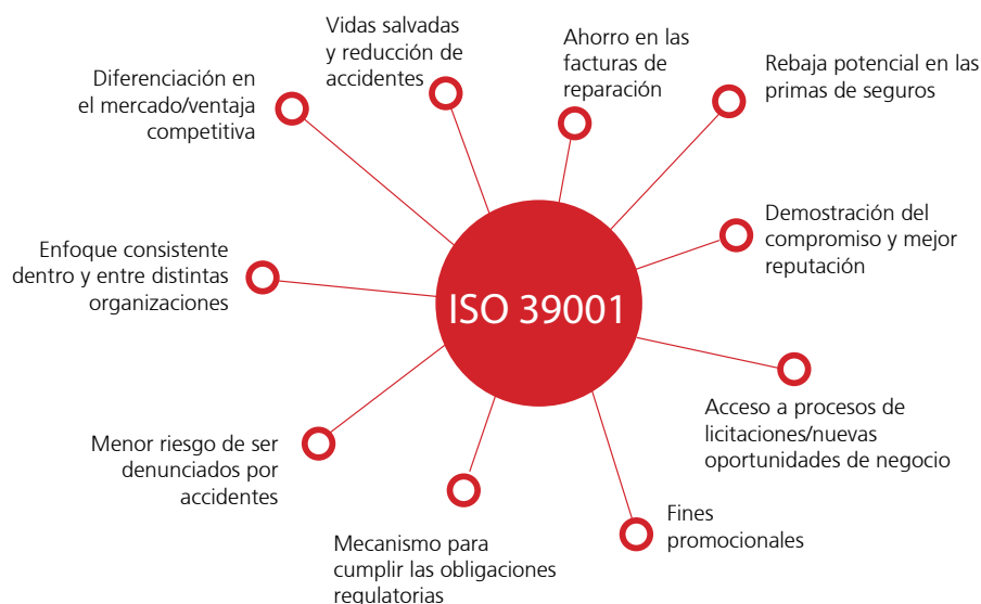
Fig. 6: Ventajas asociadas con la implementación del esquema de gestión de seguridad vial de la Norma ISO 39001

Con más de 2.000 empleados y una flota de más de 1.000 vehículos, la norma ISO 39001 ha proporcionado a Mark Group, una empresa instaladora de tecnologías de ahorro de energía, una plataforma y una estructura para cumplir y demostrar su compromiso de seguridad vial y mitigar el riesgo empresarial. El enfoque de sistema de gestión propuesto por la norma ISO 39001 les ha ayudado a reducir los recursos y costes en su departamento de flota, al tiempo que a promover la implicación y la propiedad. La norma ISO 39001 ha demostrado varias ventajas, tal y como se indica en la figura siguiente. Entre estas se incluye una auditoría continua que asegura el cumplimiento de la norma y una reducción del 60% al 40% (a pesar del aumento constante de su flota) de las colisiones en que la empresa es la parte responsable. También se ha experimentado una reducción en las reclamaciones contra los conductores y un mayor compromiso de todos los empleados, no sólo de los conductores. La conducción se gestiona a través de un abanico de medidas, como por ejemplo: formación de los conductores y directores, un manual para los conductores y definición de Indicadores de rendimiento clave (KPI) para valorar el rendimiento 57 .